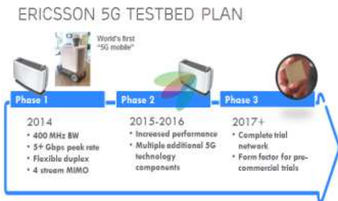
Fig. 1, Ericsson 5G Testbed Plan

本講演では 5G に関する要素技術とエリクソンの取り組みについて紹介する。まず始めに、5G のユースケース、要求事項について概観する。次に、5G 無線アクセスの展望について説明し、これらを実現するための要素技術について述べる。そして、エリクソン社の取り組みとして、現在実施中のフィールド実験について、その概要、スケジュール、選択された RAT、初期の主要パラメータ並びに得られた成果のいくつかを紹介する。