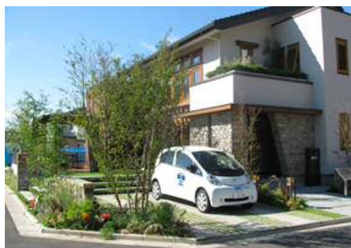
実証実験住宅外観